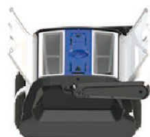
Top access to filter baskets Accès aux filtres par le haut