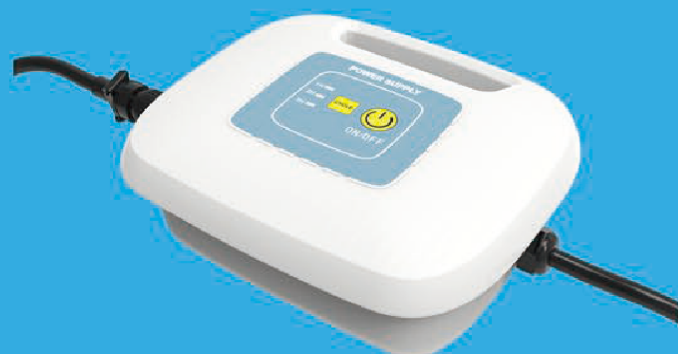
Control box Boîtier d'alimentation

3 working cycles: 1/2/3h 3 cycles de nettoyage: 1/2/3h