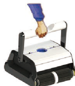
Ultra light Très léger