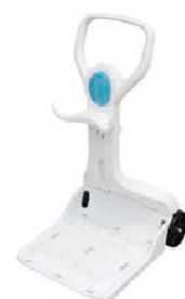
Optional caddy Chariot en option