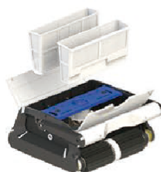
2 large-volume filter baskets Deux grands filtres à cassette